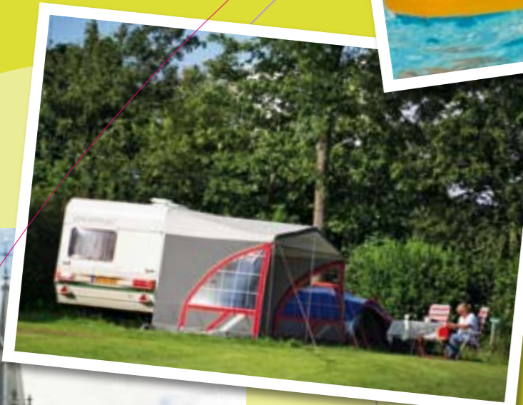
Ruime plekken omgeven door zomers groen.