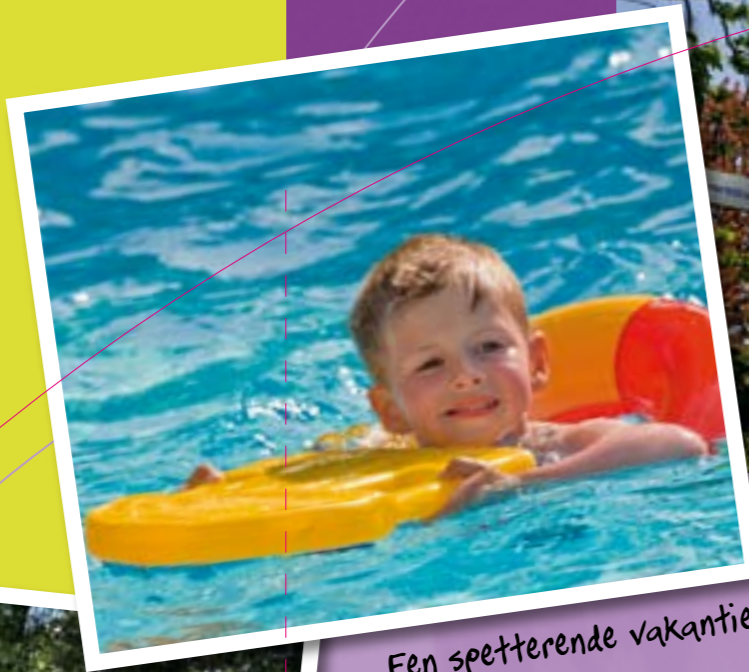
Een spetterende vakantie!