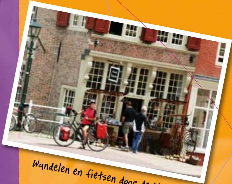
Wandelen en fietsen door de historische stad.